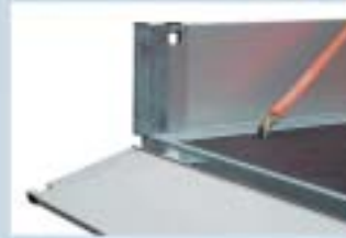
Hengslet fremre karm og surreøye