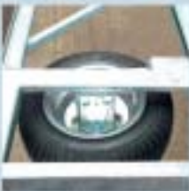
Reservehjul og -holder (ved fremre karm)