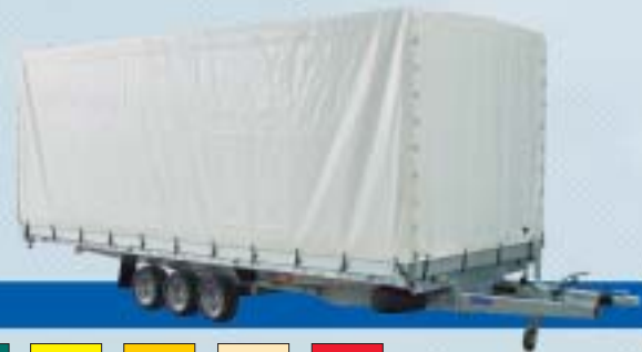
Høykvalitets kapell (åpnes på alle sider)