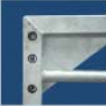
Enkel demontering av kapellstativ