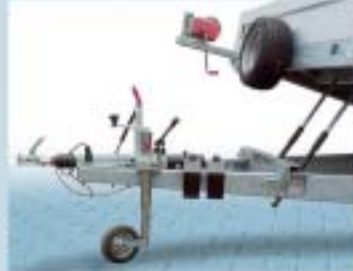
Tipphydraulikk (enkel eller dobbel, se prisliste)