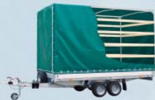
Forsinket stativ og høykvalitets presenning (åpnes fra alle sider)

Høykvalitetsduk. Fremstilt i samsvar med ISO 9002, testet fra -30°C / +70°C; 630g/m 2