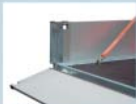
Hengslet forlem og surreøye