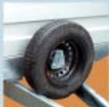
Reservehjul og -holder