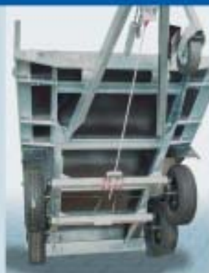
Sikkerhet og stabilitet