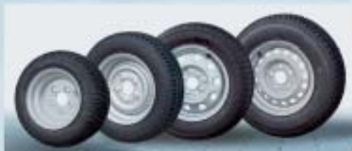
Hjulvarianter, 10", 12", 13" og 14"