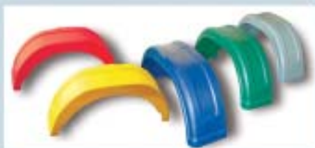
Skjermer i flere farger