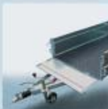
Hengslet forkarm på bremset utgave