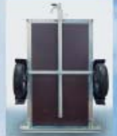
Solide hjørnebeslag, varmforsinket