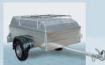
Låsbart deksel med lastegrind (kan bære 20 kg)