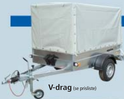
V-drag (se prisliste)